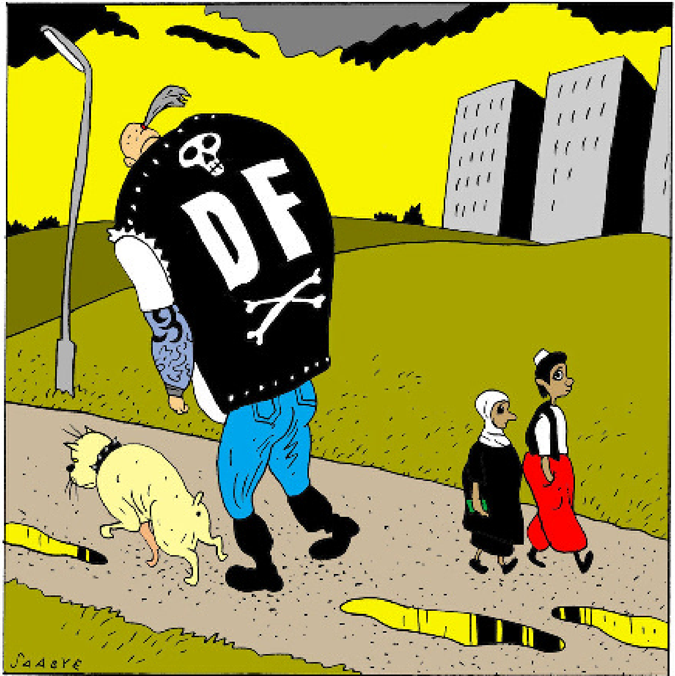
Tegning: Jørgen Saabye

Lad os bytte Dansk Folkepartis rockerelevanter politik med en ægte politik, der er forebyggende. Lad os som politikere vise danskerne, at vi tager deres bekymringer alvorligt – at vi vil gennemføre en politik, der rent faktisk virker, og som vil gøre Danmark et sikrere sted. Og ikke, som Dansk Folkeparti, blot bruge bandekrigen som billig undskyldning for at luften mere ligegyldig populisme.